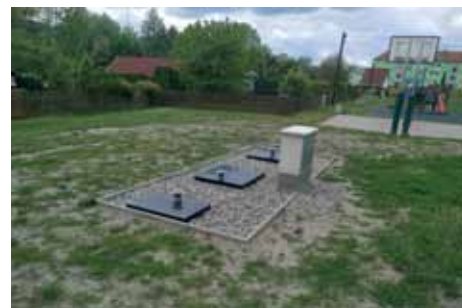
Nová čistírna odpadních vod

Z hlediska nákladů šlo o akce, které stály dohromady 6 675 656 Kč. Z toho 2 030 788 Kč je přímý náklad na samotné čistírny. Další 2 874 642 Kč stály stavební práce kolem usazení a zprovoznění čistíren. Dále domy uhradily 1 447 000 Kč za přepojování dešťové kanalizace, zaslepení septiku a za novou spláskovou kanalizaci. Poslední část nákladů ve výši 323 226 Kč je za projektovou dokumentaci, zaměření a vodoprávní řízení, nákup