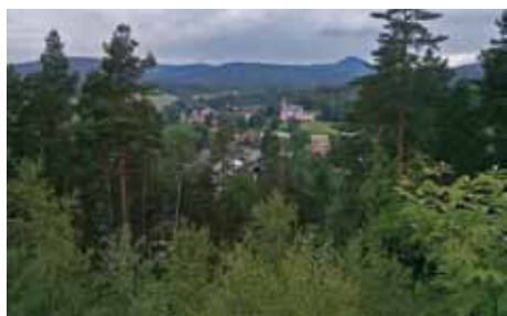
Výhled z kalvarie na Mařenice

Neztrácejme čas a vyrazme. Pokud nezabloudíme v místních lesích, čeká nás 17 kilometrů mírně náročným terénem. Z centra se vydáme po modré značce, která nás hned na úvod zavede před jednu z budov, která je aspoň pro část obyvatel Česka tou nejznámější ve Cvikově. Jde o Dětskou léčebnu zaměřenou na nespecifická onemocnění plic a horních cest dýchacích. Její historie je již více než sto let stará. Ještě za Rakouska - Uherska šlo vše rychleji. V roce 1908 byl nápad a v roce 1910 byla stavba hotová. Od počátku byla léčebna zaměřena