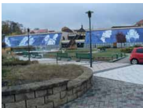
Kulturní dům Crystal

V prodlouženém funkčním období představenstva, tj. do 18. 8. 2020, je tedy nutné svolat shromáždění delegátů, na kterém proběhnou volby členů představenstva a kontrolní komise a dále bude předložena výroční zpráva družstva, jejíž hlavní součástí je řádná účetní závěrka roku 2019 a rozdělení zisku druž-